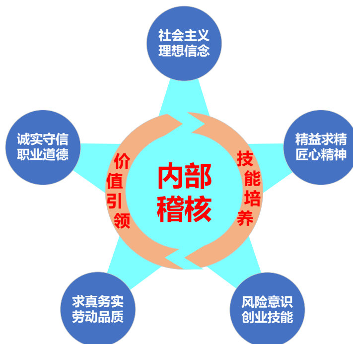
“一核两翼 五维协同”课程思政教学模式

5. 风险意识创业技能。技术变革驱动内部稽核目标发生变化，在内部稽核过程中，需要稽核人员具有更强的风险意识；同时，通过分析各种错弊的表现形式和形成原因，能够吸取经验教训，提升从业人员的从事创业工作的综合能力。