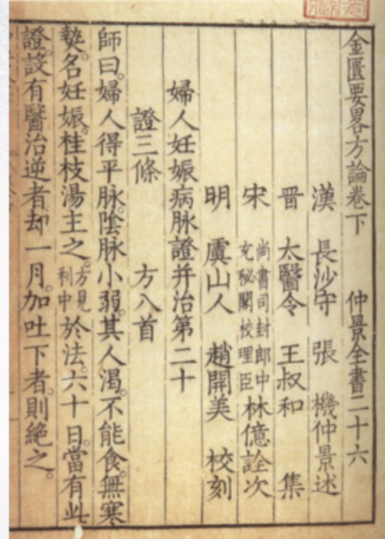
《金匱要略》（书影 1-135 中研院）